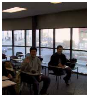
Студенты на занятиях

Студенты школы Kaplan в Бостоне в восторге от нашей культурной программы, которая предусматривает мероприятия на любой вкус. Среди самых популярных – вечерний круиз на теплоходе, наблюдение за китами в открытом океане, футбольные матчи, вечера в кино и местных ресторанах. Другие мероприятия – походы на бейсбольные, баскетбольные или хоккейные матчи, дискуссионные клубы, поездки в Нью-Йорк, Вашингтон и знаменитый парк развлечений «Six Flags» в Новой Англии.