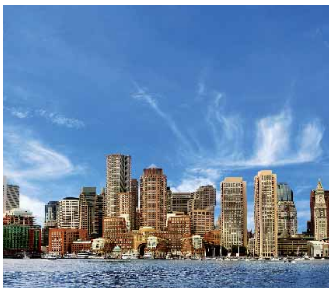
Вид на Бостон

Kaplan International Centers является членом TESOL (Teachers of English to Speakers of Other Languages) и NAFFSA (Association for International Educators).