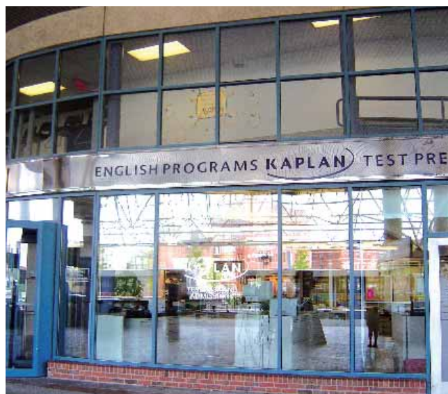
Kaplan International Center – Бостон

Обратите внимание, что сотрудники Kaplan International Centers не работают по выходным. Если вам нужна помощь – позвоните по одному из наших номеров экстренного вызова.