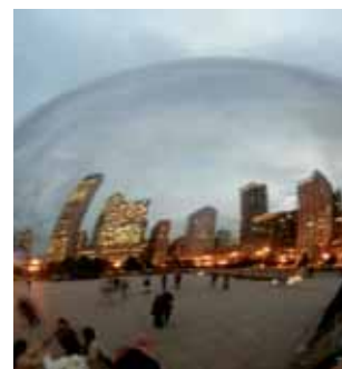
Скульптура боба в парке Миллениум