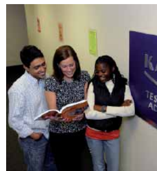
Студенты и преподаватель Kaplan