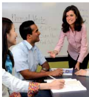
Урок в школе Kaplan в Чикаго

Kaplan International Center организует обширную культурную программу для студентов, в том числе: посещение всемирно знаменитых музеев, бесплатные концерты на свежем воздухе, катание на коньках в парке Миллениум, пешеходные экскурсии по окрестным районам и плавание на катере по озеру. Kaplan International Center также организует поездки на сбор яблок в Индиану, горнолыжные курорты в Висконсине и парк аттракционов Six Flags.