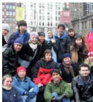
Студенты Kaplan катаются на коньках

В кино: $10 Автобус CTA: $2.25 Поезд или метро CTA: $2.25 Пересадка: $0.25