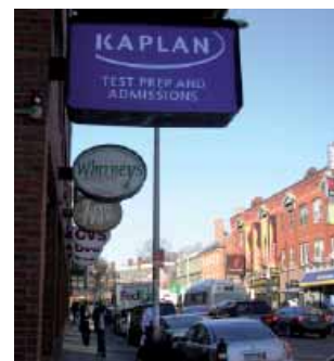
Вход в Kaplan International Center – Гарвард Сквер