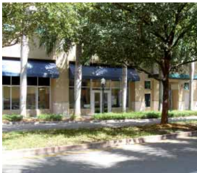
Вход в Kaplan International Center – Майами

Студенты, как правило, прилетают в выходные и сразу же едут в место проживания. Если они не запрашивают транспорт, им следует либо поехать до места назначения на такси, либо при желании воспользоваться метропоездом или автобусом. Пожалуйста, свяжитесь со школой, если вам нужна более подробная информация.