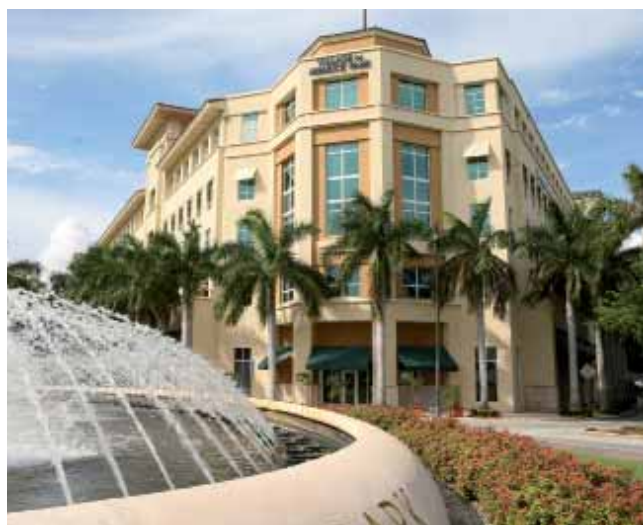
Kaplan International Center – Майами

Kaplan International Centers является членом TESOL (Teachers of English to Speakers of Other Languages) и NAFSA (Association for International Educators).