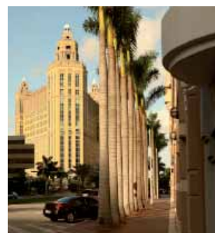
Майами – район Coral Gables