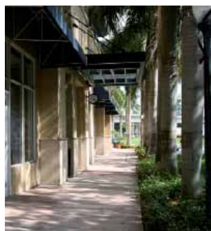
Вход в школу Kaplan

В помещении школы KAPLAN есть беспроводной доступ к Интернет.