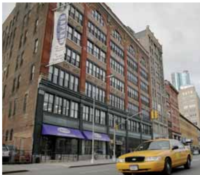
Kaplan International Center Нью-Йорк – Ист Вилладж