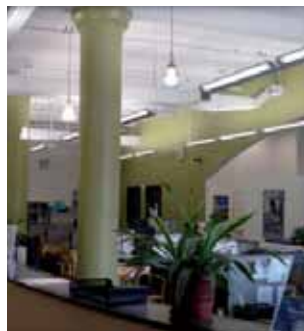
Школа Kaplan в Ист Вилладж

Не надо иметь богатое воображение, чтобы найти, чем заняться в Нью-Йорке в свободное от учебы время. Тем не менее, KAPLAN предлагает разнообразную программу мероприятий на весь период вашего пребывания. В нее включены вечеринки, пешеходные экскурсии, мастер-классы, походы в музеи, на спортивные мероприятия и в театры, и многое другое. Вы узнаете о таких местах в Нью-Йорке, о существовании которых Вы и не подозревали! Все эти мероприятия проводятся сотрудниками KAPLAN и нацелены на знакомство с городом и возможность познакомить Вас друг с другом.