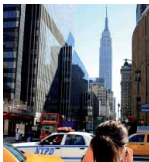
Небоскреб Empire State Building