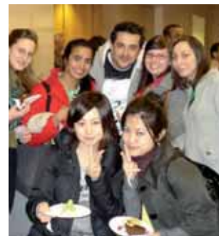
Студенческая вечеринка в Ист Вилладж