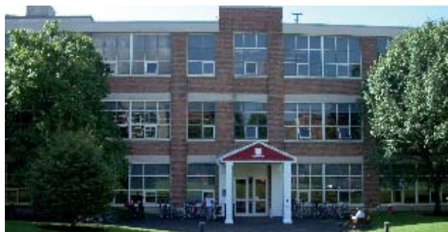
Здание Kaplan в Северо-Восточном Университете

Баскетбольная площадка и крытая беговая дорожка, разнообразные тренажеры в Marino Center. Обратите внимание, что не все спортивные объекты разрешены к использованию студентами до 18 лет. Студенты, которым еще нет 18, получают компенсацию. Уточняйте информацию у директора школы.