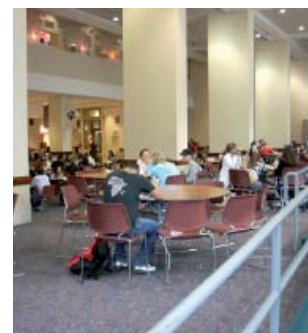
Студенты в Северо-Восточном Университете