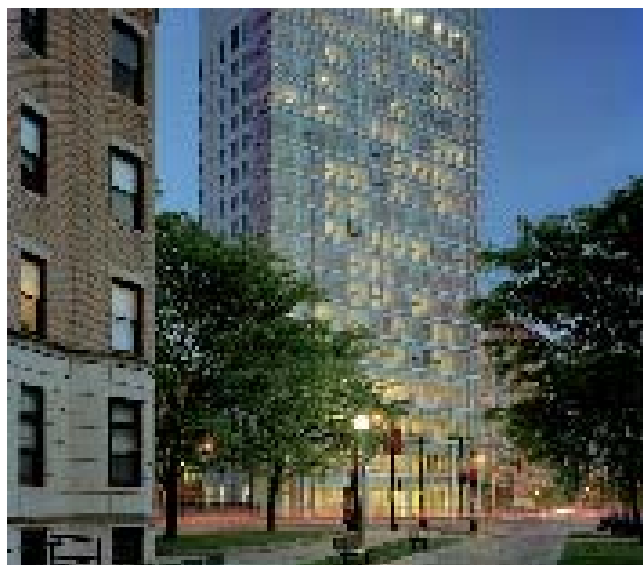
Кампус Северо-Восточного Университета

Представитель компании New England Coach будет ждать Вас в зоне выдачи багажа. Он или она будет держать табличку Kaplan.