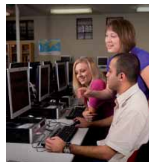
Учебный центр / библиотека