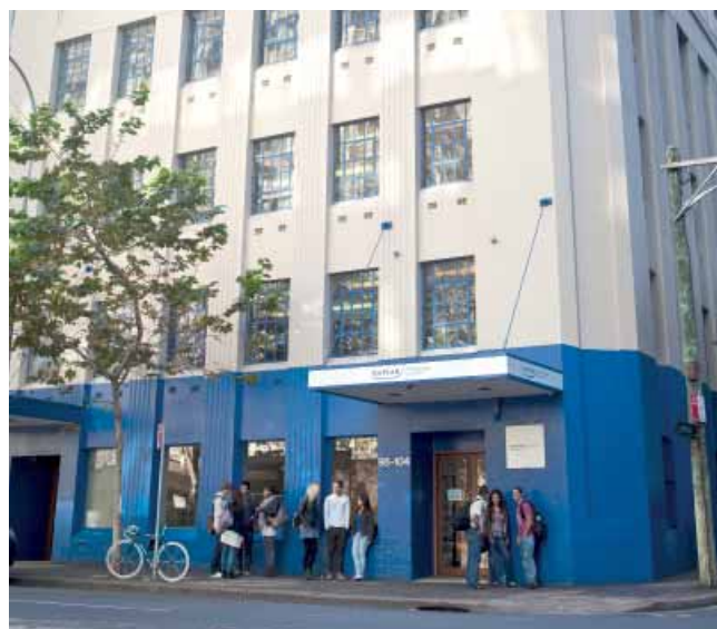
Kaplan International College – Сидней

Сидней – это лучшее место, чтобы насладиться потрясающей архитектурой, пляжным отдыхом, насыщенной культурной программой и бурной жизнью мегаполиса. После целого дня занятий будет приятно посидеть в кафе на набережной с чашечкой капучино, а на выходных отправиться на пляж Бонди, где сиднейцы любят поваляться на солнце и насладиться первоклассным серфингом.