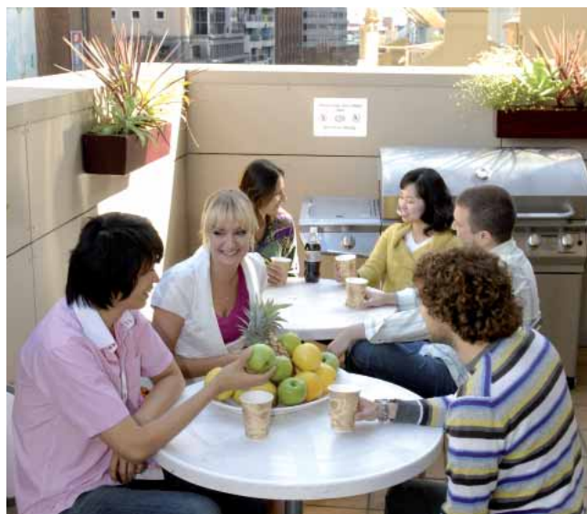
Балкон студенческого кафе

+61 414 605 593 (транспортная компания), или +61 425 320 801 (экстренный номер школы).