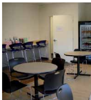
Новый студенческий холл

Персонал Kaplan организует различные мероприятия для студентов, в том числе поездки на бейсбольные и баскетбольные матчи на Dodger Stadium или в Staples Center, поездки на выходные в Лас-Вегас, Диснейленд или Universal Studios. Вы можете общаться с другими студентами во время походов в кино или рестораны, футбольных матчей в парке или пляжных вечеринок.