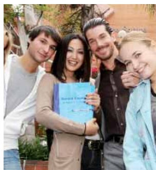
Студенты Kaplan Лос-Анджелес, Вествуд