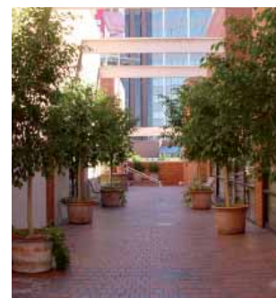
Внутренний дворик школы Kaplan