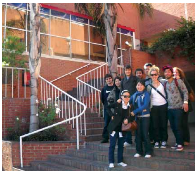
Kaplan International Center – Лос-Анджелес, Вествуд

Kaplan International Centers является членом TESOL (Teachers of English to Speakers of Other Languages) и NAFSA (Association for International Educators).