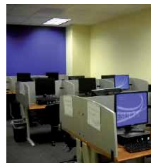
Новый компьютерный класс