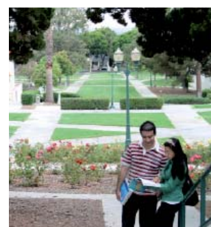
Кампус Колледжа Уиттиер