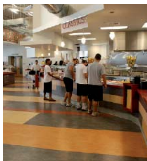
Столовая Колледжа Уиттиер