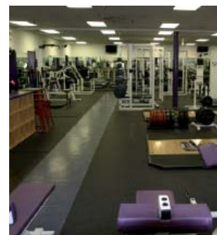
Фитнес-центр Колледжа Уиттиер