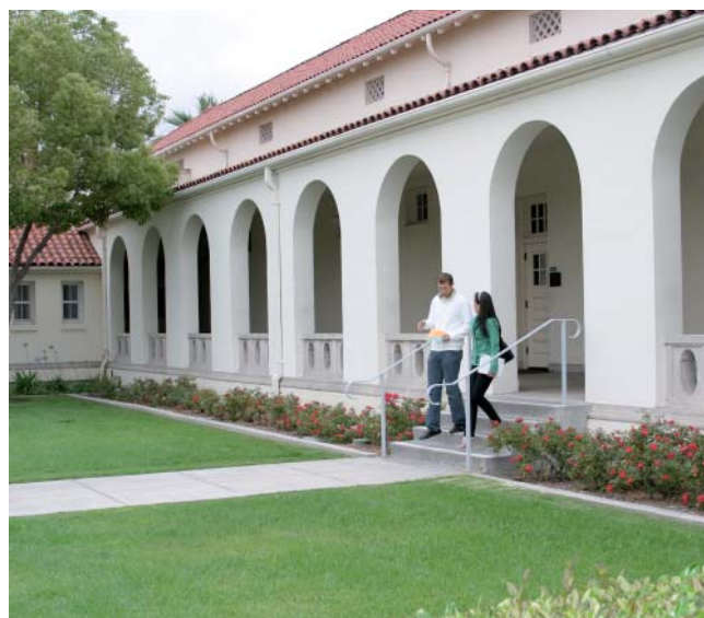
Кампус Колледжа Уиттиер

Kaplan International Centers является членом AAIEP (American Association of Intensive English Programs), TESOL (Teachers of English to Speakers of Other Languages) и NAESA (Association for International Educators).