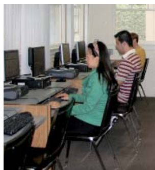
Студенческий холл в Kaplan

У Колледжа Уиттиер довольно живой кампус, здесь действуют многие студенческие клубы и устраиваются разные мероприятия, и студентов KAPLAN всегда рады видеть. Мы также разрабатываем обширную круглогодичную программу дополнительных мероприятий, включающих в себя поездки в Disneyland, Magic Mountain или Universal Studios. Также организуются экскурсии в Лос-Анджелес, в том числе на Родео-Драйв, а также в Малибу, Венис-Бич и аквапарк Sea World в Сан-Диего. Также устраивается много мероприятий на кампусе.