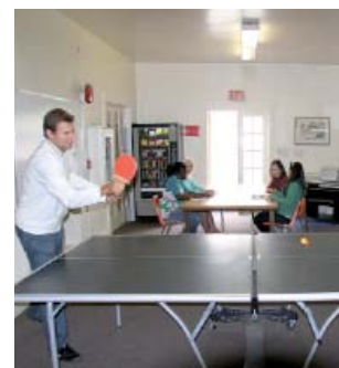
Мультимедийный центр в Kaplan